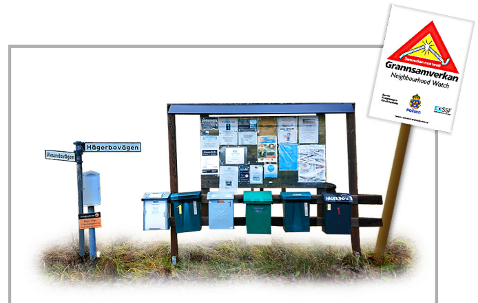
Det finns nio anslagstavlor i området.