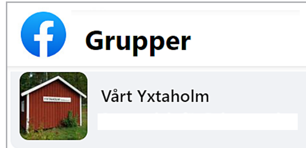
Facegruppen Vårt Yxtaholm